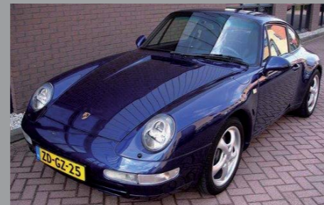
Porsche 993 Carrera 2 Tiptronic 1993