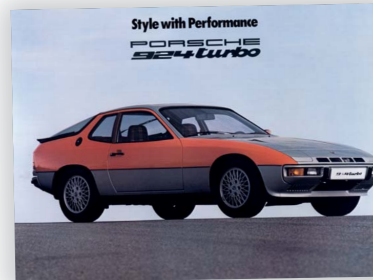
DE ORIGINELE PERSFOTO VAN DE 924 TURBO

spreken staat de auto dan ook op de brug om hem van onderen even goed te inspecteren. Even daarvoor zijn nieuwe stootstrips rondom geplaatst omdat 'de oude er niet geheel fris meer uitzagen'. Het getuigt wel van de liefde die een eigenaar kan hebben voor z'n auto. Wanneer er een tas met 'oude' brochures, tijdschriften en boeken naar boven komt, blijkt des te meer de passie voor de 924 Turbo en met name deze specifieke kleurencombinatie. Rijtesten van Turbo's uit eind jaren '70 met auto's in dezelfde kleurstelling spreken nog wel het meest tot de verbeelding, evenals de originele brochure van zijn 924. Of het nu Duitse magazines zijn of oude Autovisie's, alles passeert de revue en over alles spreekt Harold even passievol.