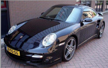
Porsche 997 Turbo Tiptronic 2006

6 dagen per week geopend, graag op afspraak. Tel: 0297 520911, GSM: 06-53622911