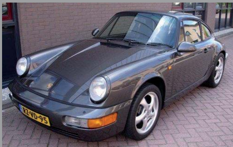
Porsche 964 Carrera 2 Coupe 1990