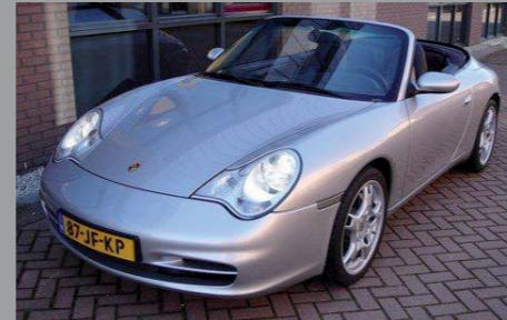
Porsche 996 Carrera 4 Cabriolet 2002

Kijk voor meer Porsches op www.hansbos.nl