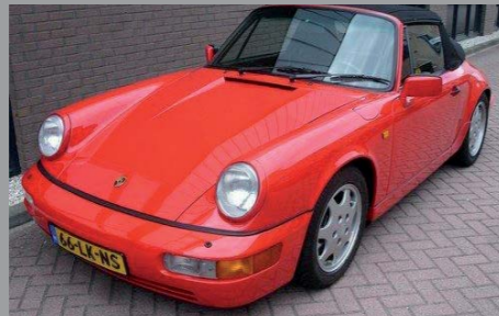
Porsche 964 Carrera 2 Cabriolet 1991